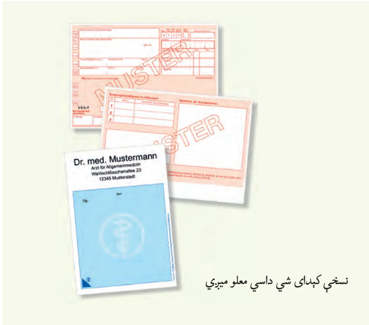
نسخې کېدای شي داسې معلو مېږي