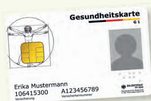
Uzorak zdravstvene kartice

Uvijek ponosite sa sobom svoju elektronsku zdravstvenu karticu kada koristite zdravstvene usluge. Od 1. januara/siječnja 2015. god. ova kartica važi/vrijedi kao isključivi dokaz prava na usluge iz ob(a)veznog zdravstvenog osiguranja. Na elektronskoj zdravstvenoj kartici memorisani/pohranjeni su vaše ime i prezime, datum rođenja i adresa, kao i broj vašeg zdravstvenog osiguranja i vaš osiguranički status (osiguranik, član porodice/obitelji ili penzioner/umirovljenik) kao ob(a)vezni podaci. Osim toga, elektronska zdravstvena kartica sadrži i vašu sliku.