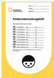
Ovako izgleda knjižica pregleda kod djece (U-Heft).

Ovi pregledi su veoma važni. Zato vas molimo da odete na sve ove preglede i uvijek ponesite sa sobom knjižicu za upisivanje pregleda („U-Heft“), kao i vakcinalni karton/knjižicu cijepljenja svog djeteta. Ovi pregledi su u službi zdravlja vašeg djeteta.