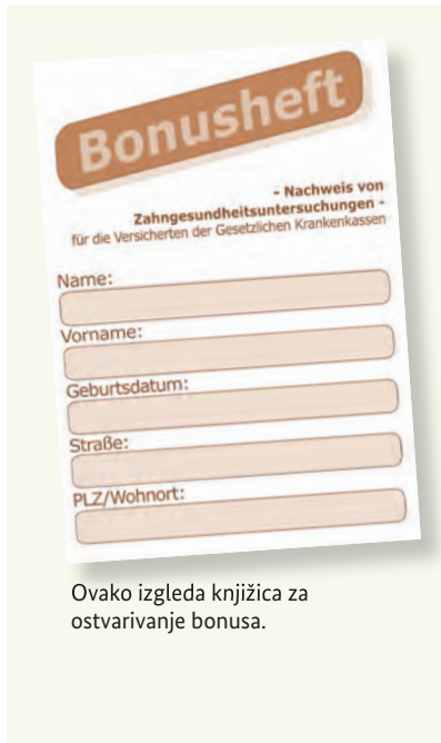
Ovako izgleda knjižica za ostvarivanje bonusa.

Zdravi zubi su sastavni dio kvalitetnog života. Zato su važni redovni preventivni pregledi – čak i ako nemate nikakvih problema sa zubima. Fondovi/Zavodi ob(a)veznog zdravstvenog osiguranja plaćaju i troškove ovih preventivnih pregleda. Ovi pregledi pomažu da se određena oboljenja otkriju na vrijeme i liječe. Za te preglede dobit ćete od svog fonda/zavoda takozvanu „Knjižicu za ostvarivanje bonusa (Bonusheft)“. U ovu knjižicu upisuju se preventivni pregledi. Ako možete da dokažete da ste najmanje jednom godišnje (za osobe mlađe od 18 godina, najmanje jednom u pola godine) bili kod zubara, fond/zavod (Krankenkasse) plaća veći dodatak u slučaju ugradnje vještačkih zuba.